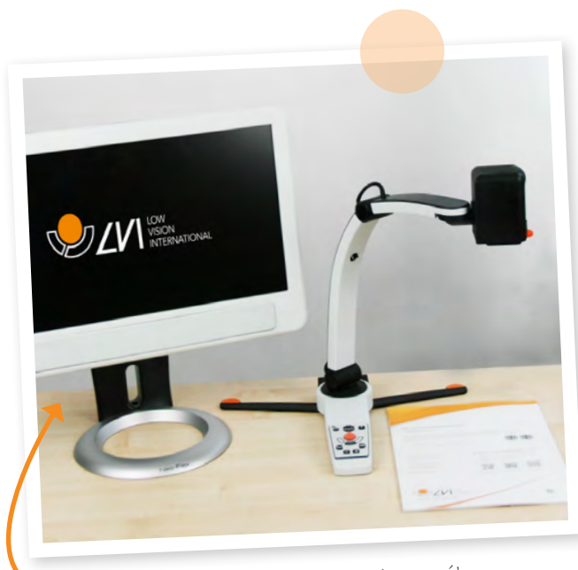
Monitor - entwickelt für Menschen mit Sehbehinderung.

Wir bieten eine breite Palette von einzigartigem Zubehör, mit dem sich das MagniLink S Premium 2 noch vielseitiger, effektiver und intelligenter nutzen lässt! Unser Zubehör ist in Funktion und Design perfekt auf unsere MagniLink-Produkte abgestimmt.