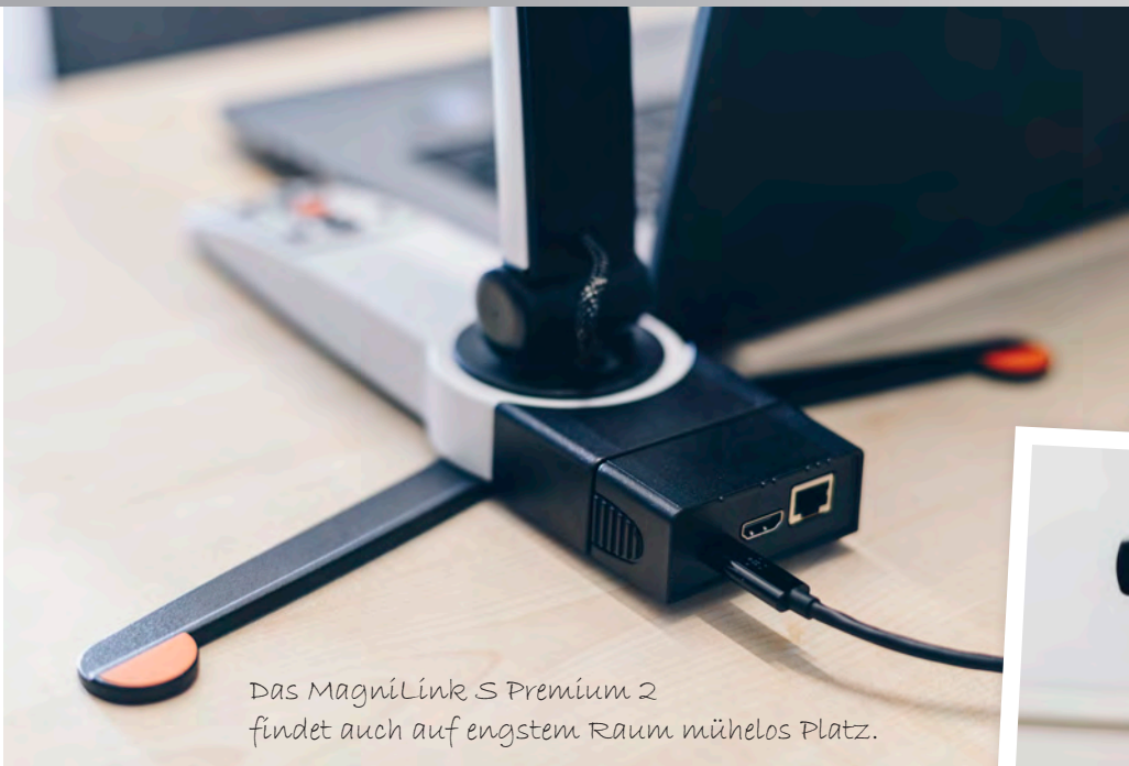
Das MagniLink S Premium 2 findet auch auf engstem Raum mühelos Platz.